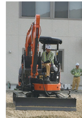
ICT搭載 小型バックホー

2019年度は4支店でICT施工対応可能な小型重機を配備しました。これにより道路が狭い中小規模の工事でもICT施工が可能となり、精度向上による施工の効率化と工期短縮につながっています。