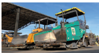
日本に数台しかない特殊な舗装機械を多数保有

高速道路や空港滑走路などの特殊工事で使用する機械の運用管理を行い、品質・生産性向上を念頭に、各工事現場に適した機械を供給しています。また、日々の点検・整備業務を徹底し、特殊施工現場への技術指導や運転操作要員の派遣など、不具合工事0%に向けた取り組みを行っています。