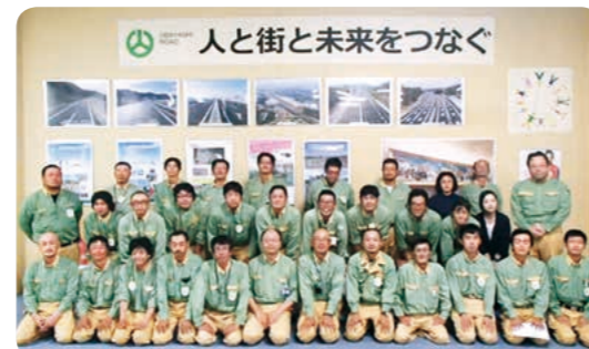
常磐自動車道双葉地区舗装工事を担当した職員