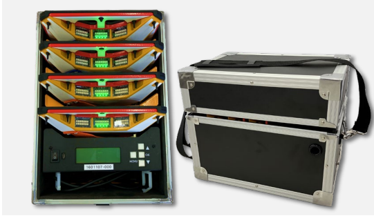
▲ ミチレスQ収納兼充電BOX