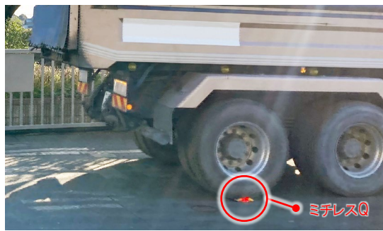
▲ 大型ダンプ踏付け実験