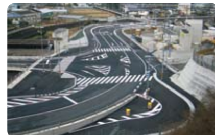
平成 24 年度 天神地区外舗装工事