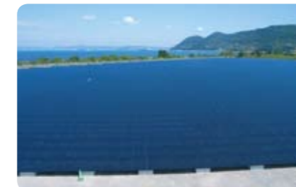
坂出ソーラーウェイ新設工事