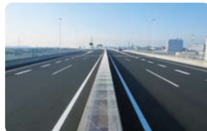
首都圏中央連絡自動車道 西久保 JCT ~ 寒川北 IC 間舗装工事