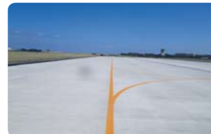
徳島 (23 震災関連) 駐機場等整備工事