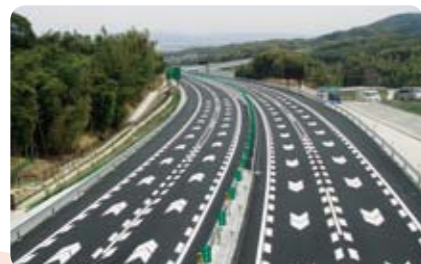
京都縦貫自動車道 京都舗装工事