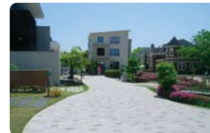
ABCハウジング千里住宅講演会場リニューアル工事